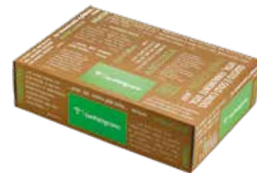
Scatola regalo verde chiaro 35x20x10 cm

Vassoio in legno di rovere di recupero da barrique e botti esauste 30x20x1 cm con foro da 3 cm San Patrignano