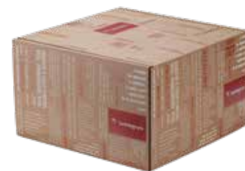
Scatola regalo rossa 40x40x24 cm