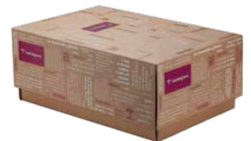
Scatola regalo vinaccia 60x40x24 cm

Tè nero a foglia intera Lago delle ninfee 50 gr La Via del Tè