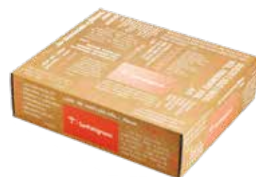
Scatola regalo arancione 35x30x10 cm

Olio EVO premiato 5 gocce Bibenda 0,5 lt San Patrignano