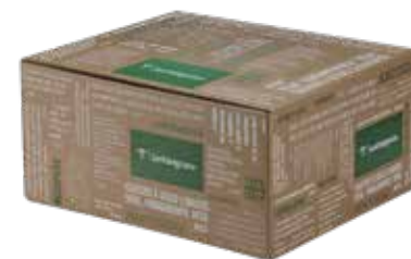
Scatola regalo verde 33x33x20 cm

La ricchezza di significato e di valori positivi che questo panettone rappresenta sono raccontati dall'accattivante grafica.