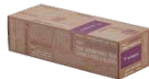
Scatola regalo lilla 35x13x10 cm

Confettura extra di pesche 270 gr San Patrignano